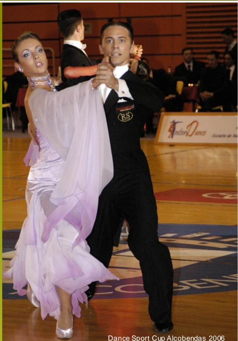
Dance Sport Cup Alcobendas 2006