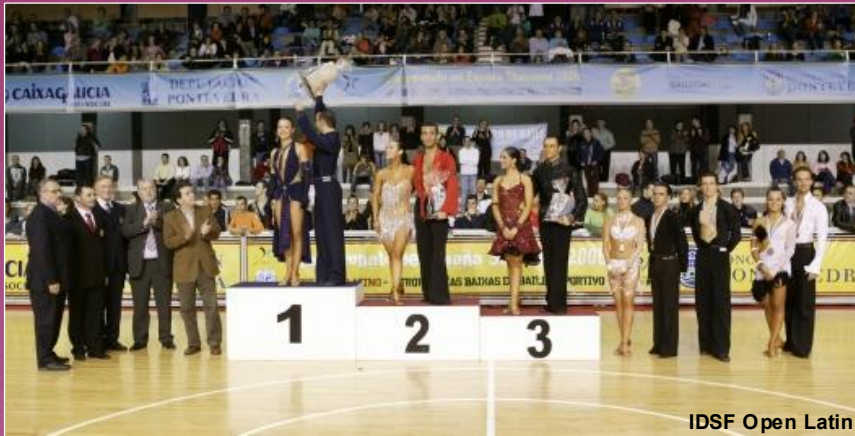
IDSF Open Latin