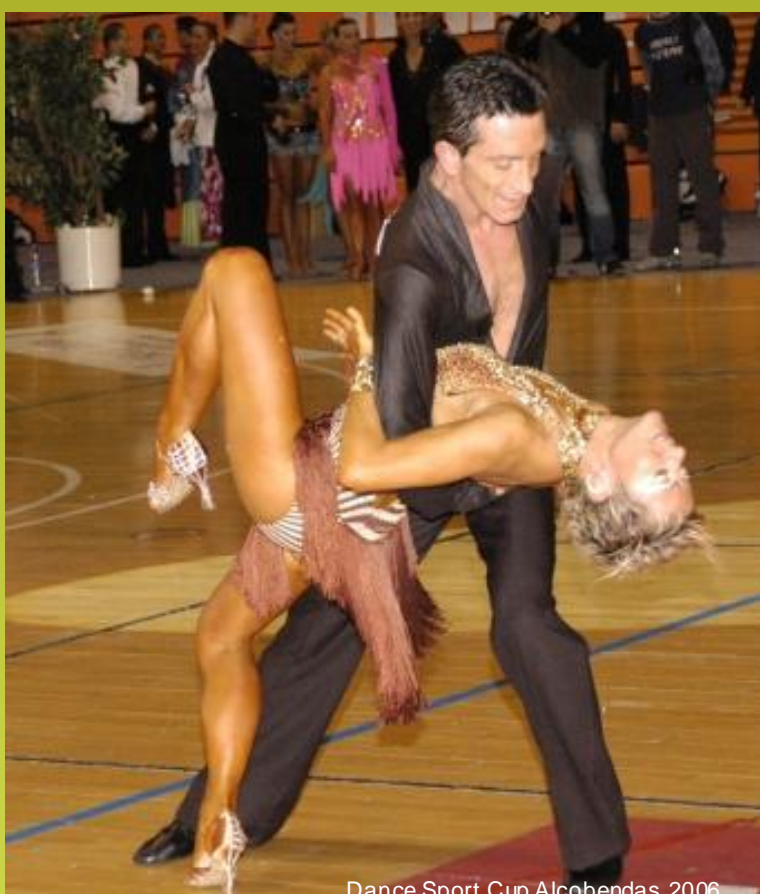
Dance Sport Cup Alcobendas 2006