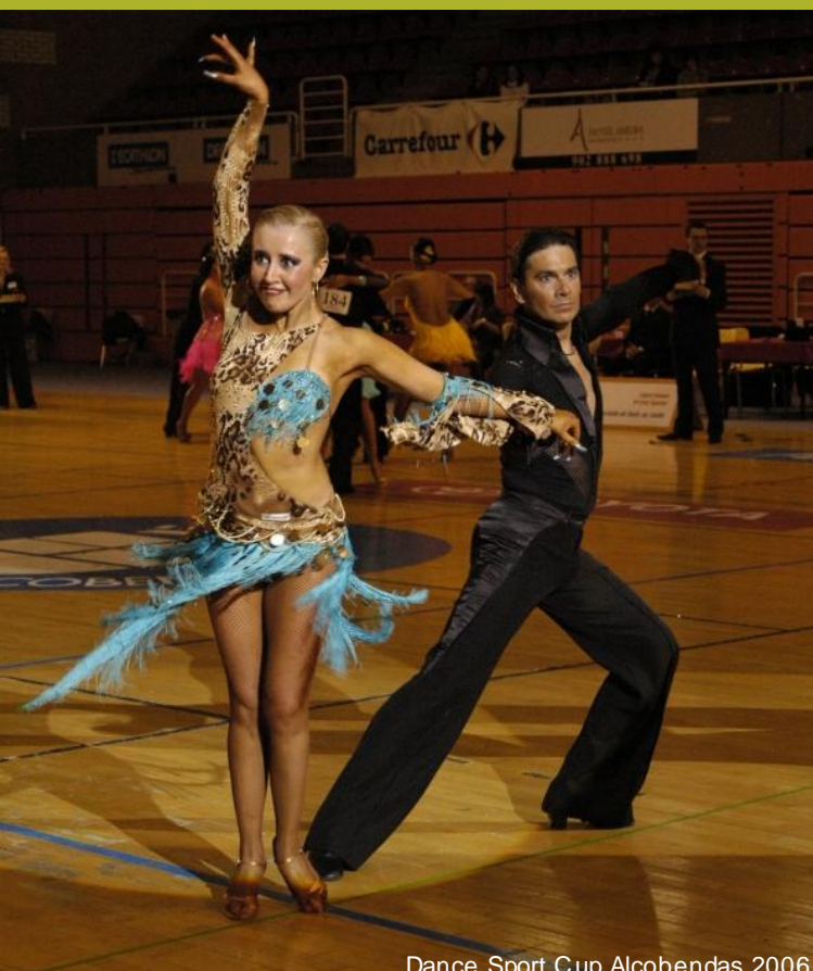
Dance Sport Cup Alcobendas 2006