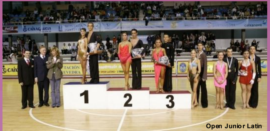
Open Junior Latin