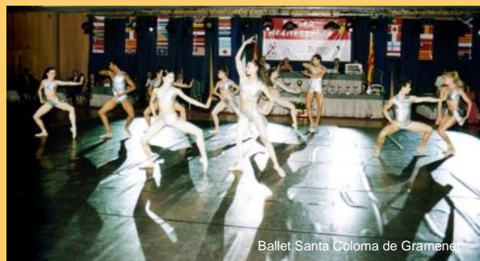
Ballet Santa Coloma de Gramenet

El sábado bailaron Adulto II, Senior I y Youth ,