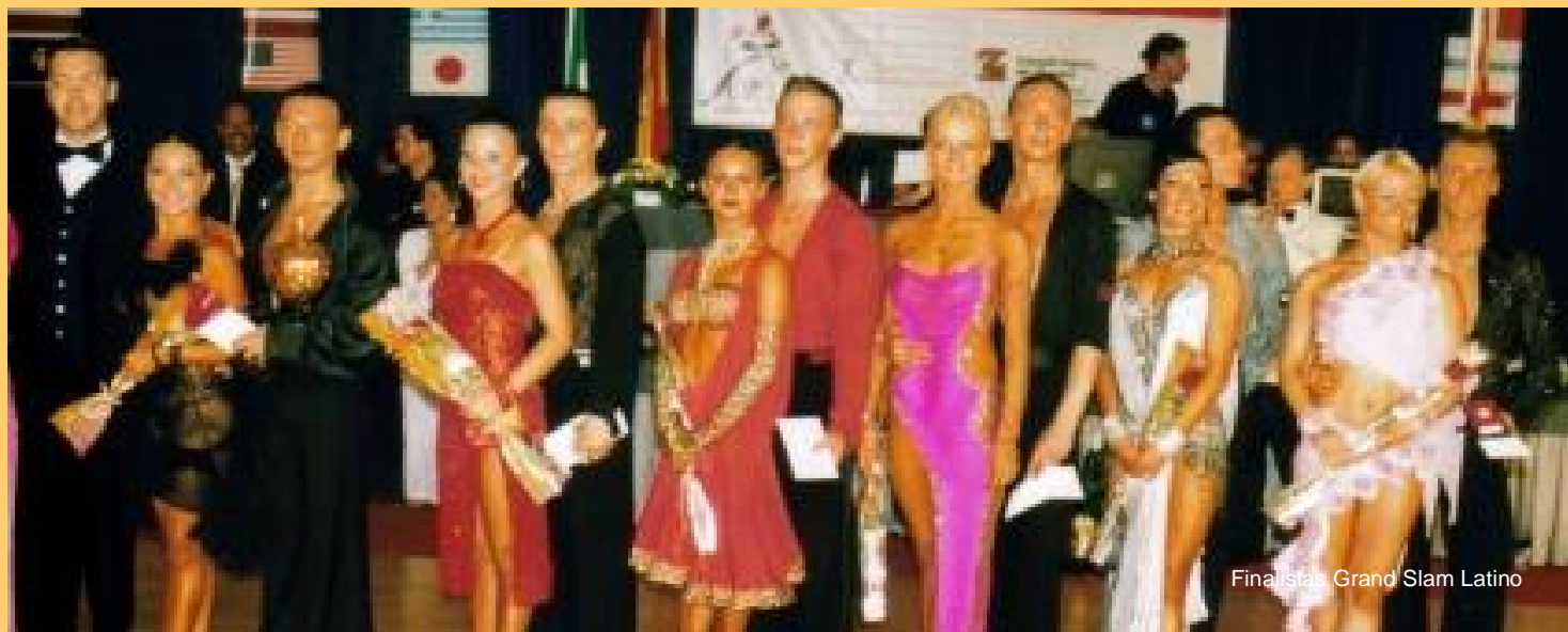
Finalistas Grand Slam Latino